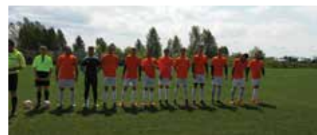
TABELA LIGOWA A KLASY (dane na dzień 16.06.2015 r.)

Do rozegrania została ostatnia kolejka spotkań. Zadziór podejmie na własnym boisku Łagoszów Łagoszów, a Płomień zagra z Dragonem Jaczów.