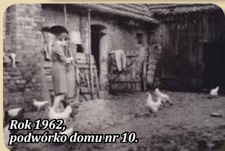
Rok 1962, podwórko domu nr 10.