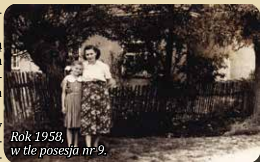
Rok 1958, w tle posesja nr 9.