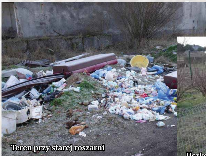
Teren przy starej roszarni