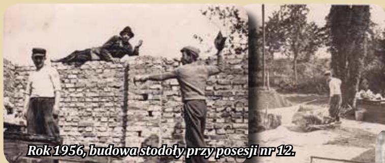
Rok 1956, budowa stodoły przy posesji nr 12.