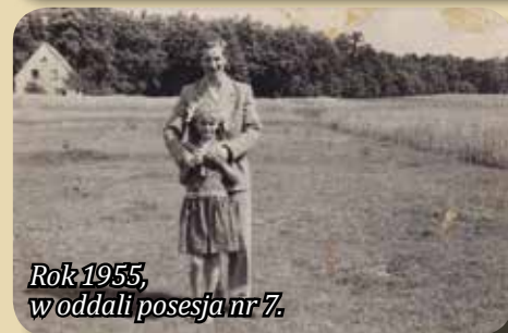
Rok 1955, w oddali posesja nr 7.