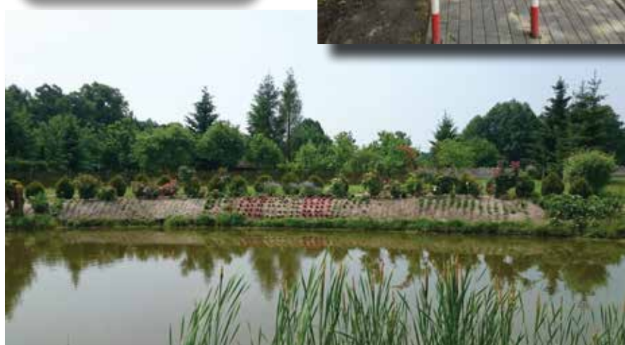
↓ Zagospodarowanie stawu w Sieroszowicach

Harmonogram zebrań sołeckich w sprawie podziału środków funduszu sołeckiego na rok 2016. Wszystkie zebrania o godz. 18:00.