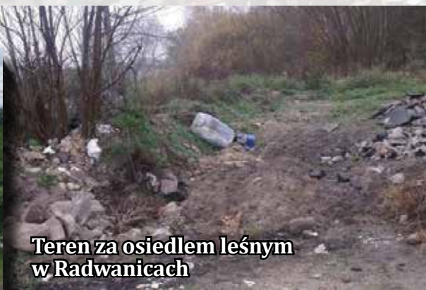
Teren za osiedlem leśnym w Radwanicach