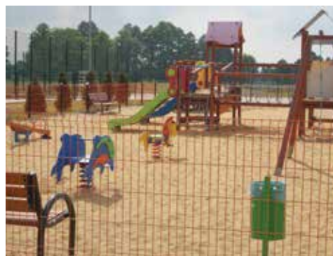
← Doposażenie placu zabaw w Buczynie

Oto tylko kilka przykładów dobrych praktyk wykorzystania funduszu sołeckiego: