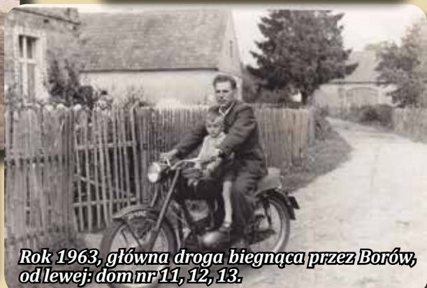
Rok 1963, główna droga biegnąca przez Borów, od lewej: dom nr 11, 12, 13.