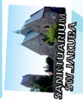
SANKTUARIUM ŚW. JAKUBA