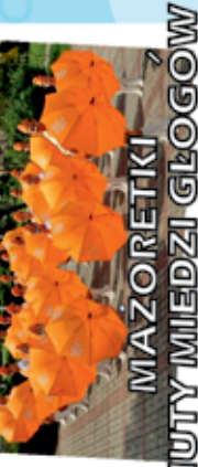
MAZURETKI HUTNY MIEDZI GŁOGÓW