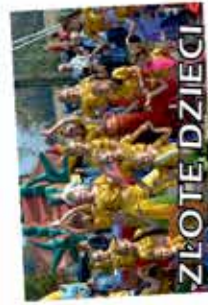
ZŁOTE DZIECI 7 LIPCA 2015