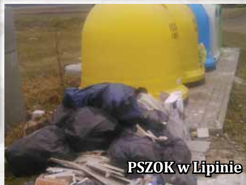
PSZOK w Lipinie