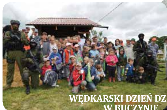
WĘDKARSKI DZIEŃ DZIECKA W BUCZYNIE

W tym roku w wielu miejscowościach naszej gminy obchodziliśmy „Dzień Dziecka”. Dziękujemy wszystkim sołtysom, radnym zaangażowanym osobom, które przyczyniły się do organizacji tego dnia w swoich miejscowościach. Poniżej przedstawiamy kilka krótkich foto - relacji z poszczególnych miejscowości.