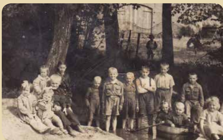
Rok 1955, rów płynący przez wioskę, w tle posesja nr 9 - miejsce zabaw dla najmłodszych mieszkańców Borowa.

Z kolei w latach 80-tych mieszkańcy zrobili boisko w lesie, na którym młodzież spędzała wolne chwile, a podczas odpustu w kościele św. Jakuba Apostoła Starszego w Jakubowie orga-