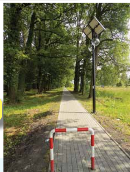
Partycypacja w kosztach budowy alejki z Radwanic do Łagoszowa Wielkiego →