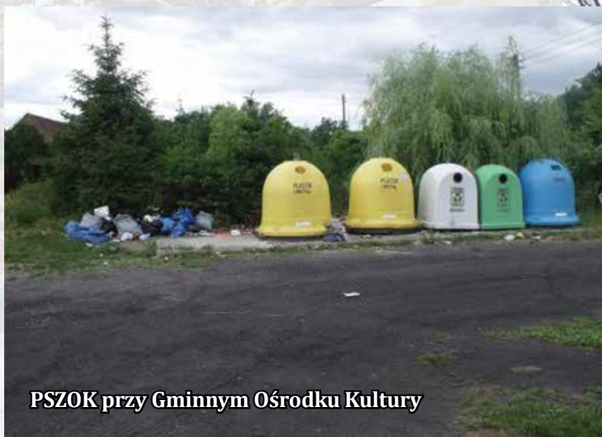
PSZOK przy Gminnym Ośrodku Kultury

Poniżej przedstawiamy tylko kilka miejsc z naszej okolicy: