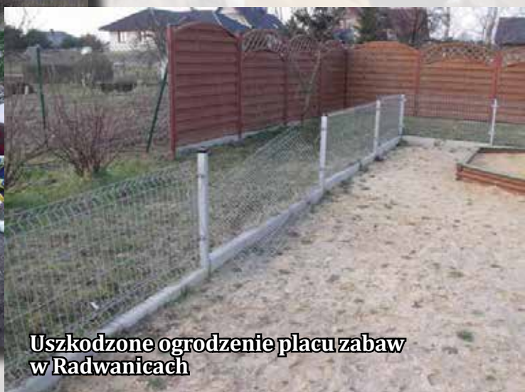
Uszkodzone ogrodzenie placu zabaw w Radwanicach