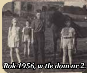
Rok 1956, w tle dom nr 2.