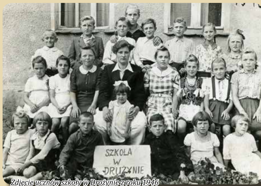
Zdjęcie uczniów szkoły w Drożynie z roku 1946