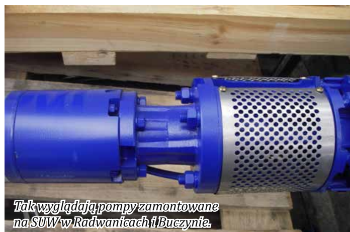
Tak wyglądają pompy zamontowane na SUW w Radwanicach i Buczyńcu.